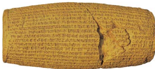
The first human rights cylinder

This ancient country has the memories of eight years of holy defense of its divine values and merits along with its martyrs shining in its history. Fully introducing Iran, however, with its ancient civilization and various scientific, cultural, religious, social, economic and political aspects which are of interest all over the world, is a delicate and artistic task out of the capacity of this book.