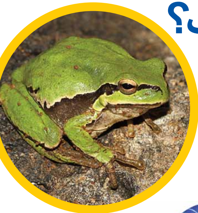
▲ قورباغه‌ی سبز درختی