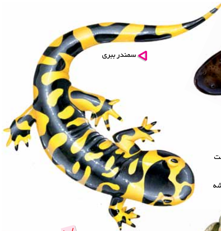
▽ سمندر هلبندر